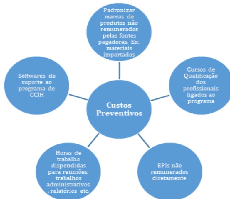
Figura 3 - Custos preventivos

Já os custos preventivos, como bem sugere o nome, são aqueles gastos destinados a evitar ou diminuir os eventos de IH e, diferentemente dos custos diretos, estes não podem ser repassados aos usuários. E essas intervenções profiláticas são provadas, através de estudos, que os resultados são muito positivos (FERNANDES et al. , 2018). E para instituir e manter um programa de controle de IH, a instituição terão gastos como os listados na figura 1 a seguir.